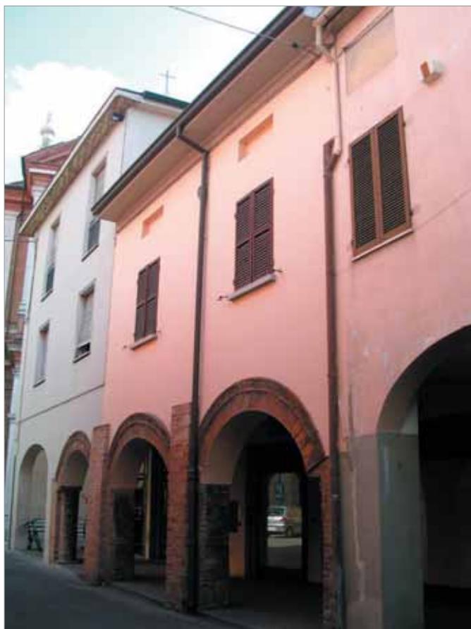
Via Garibaldi 5 Fronte Principale